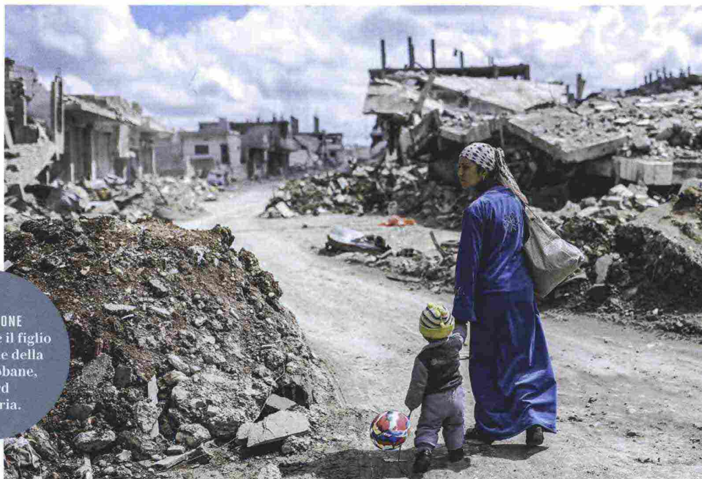
SOLO DISTRUZIONE Una donna e il figlio tra le rovine della città di Kobane, al nord della Siria.